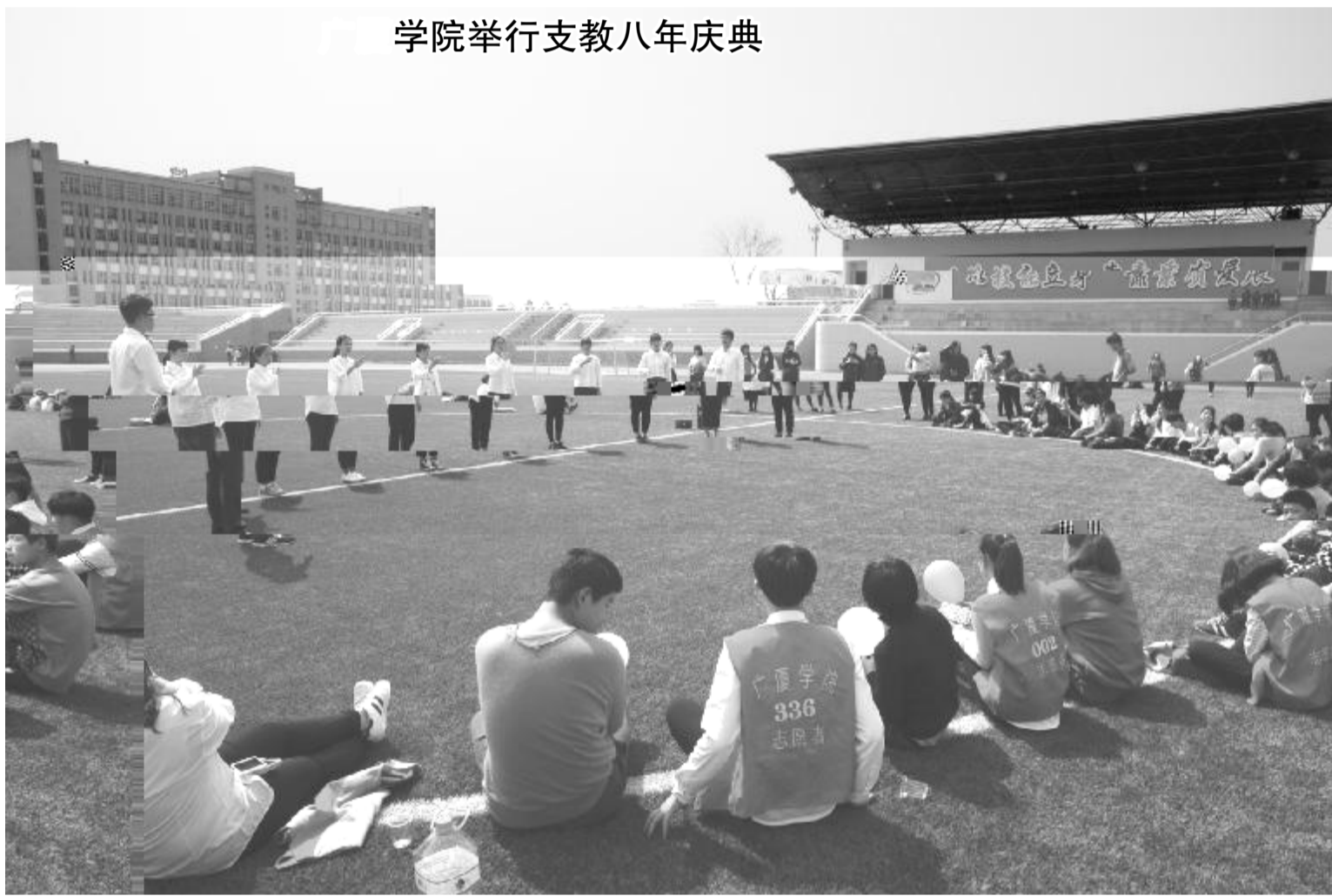
学院举行支教八年庆典

3 18 日)R 89$ )们I A 88r) 参加] 八PE 8 外] r \ ] / E 协a 9 89 ] 3 N八 EN B)9e八E·] 人 Bf· f·)但 者$ f致)<=也 q + 8 9 2 n) 者给 )带I BPE 表 8大 家K /: q JK)欢乐$ 舞I B )们脸n %&$笑%8压轴$暖 J语表也 )们 倍5亲切8 者们9 n ]许 U 望9以 $日) ) 们 更O$op)为e些 )们带I 更O$欢 乐8 殊89$] < =)i 裁$b大8' $ 奉献! )yb$b )X彩斑斓$ ) I) 们af[都98Y (文/包尔娃、毛 扬、王丹红、陈思廷 图 / 颜佳江)