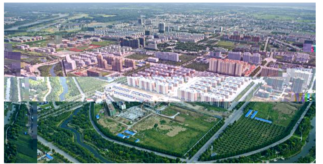
的项目施工 前 行施 期优 项目施工任 项目打造 工准 工作 项目相关负责 表示 严格按照 得起时间检验的 品 标杆工程 施工 案 严把施工安 关 关 ! " # $ %

居 安 和 居 指 是 造 和 建设 的 阜阳颍上 区 东阳三建江淮公司最大的 目前 江淮公司 的 建 30 亿元 园项目 造价 6.56 亿元 是 公司 水 园项目 中标的 造价 5 亿元的项目 项目 于 江 市 县 建 25.4 , 中 上 建 205298 计 施工工期 750 天 中标的项目施工承包范围包 建安 工程 市政 围 工程 等 工程内 是 上的施工 承包项目 由于项目 大 工期 施工 等 的 前 期 工 建 安 工 由安徽分公司 建